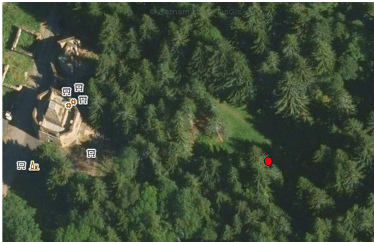
Obr. 1: Umístění tří ploch A, B, C o velikosti 60 cm × 40 cm na lokalitě č. 66. Místo u smrků (50°25'30.8"N, 13°1'31.8"E), kde se plochy nachází je vyznačeno červenou tečkou.

Výsevová plocha na lokalitě č. 66. Kovářská (okres Chomutov): u Vápenky, palouk u bývalé vápenné pece, ca 883 m n. m.